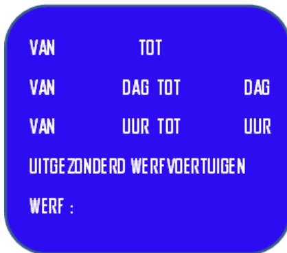
MODEL 2 (BLANCO)