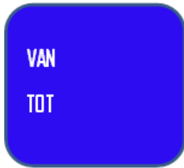
MODEL 1 (BLANCO)