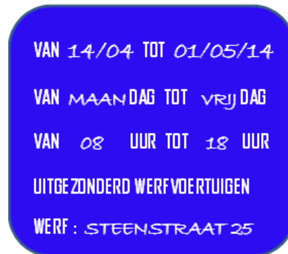
MODEL 2 (INVULVOORBEELD)