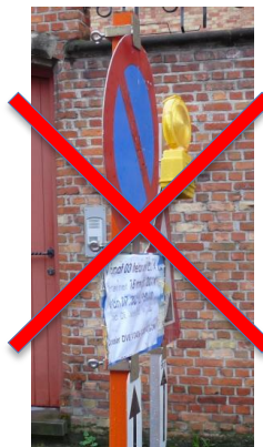
NIET- CONFORM BORD E1 (geen dubbele omranding)