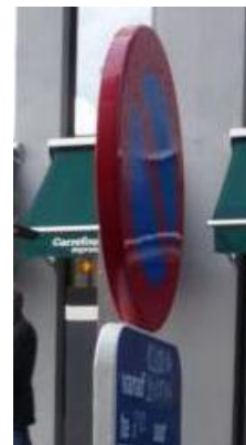
CONFORM DUBBEL OMRAND VERKEERSBORD