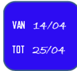
MODEL 1 (INVULVOORBEELD)