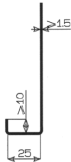
DWARSDOORSNEDE VERKEERSBORD MET DUBBELE OMRANDING